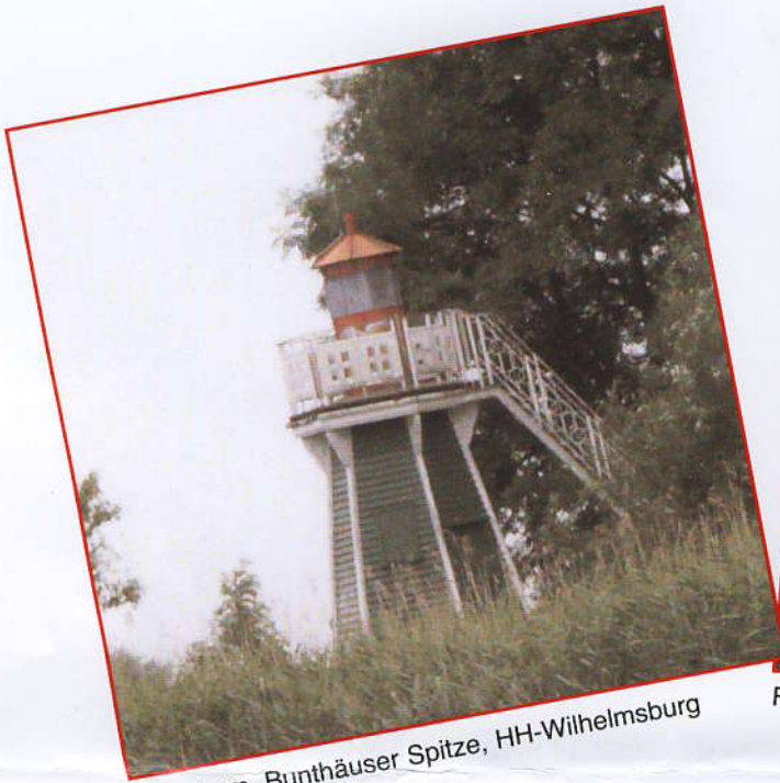
Leuchtturm, Bunthäuser Spitze, HH-Wilhelmsburg

Für ein großformatiges Memory + Lesespiel + den Internationalen Elbinsel-Kalender werden 76 Bilder + 76 GewinnerInnen gesucht!